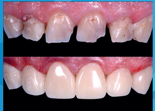
Restaureringer med monokromatisk layering i alvorligt medtaget anteriore tænder. Farve: MEDIUM af Tdl. Fraser Tait, UK